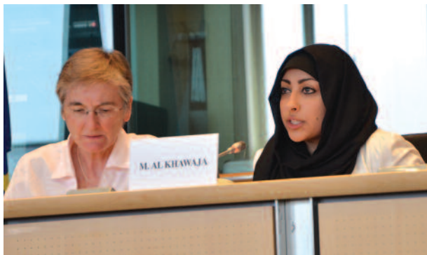
Maryam Al-Khawaja, Bahreïn, prononce un discours au Parlement européen lors d'un événement célébrant le premier anniversaire du Cadre stratégique de l'UE pour les droits humains, 2013