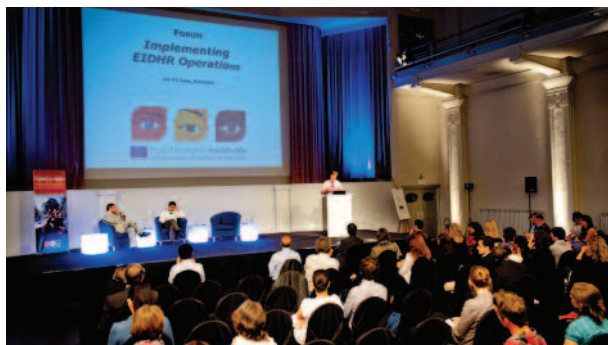
Forum de l'Instrument Européen pour la Démocratie et les Droits de l'Homme, Bruxelles, 2011.

Les DDH devraient chercher à obtenir un financement d'urgence pour des mesures de protection auprès des Missions de l'UE ou de la Commission européenne à Bruxelles. Les DDH peuvent aussi s'impliquer dans une demande de financement de projet. Les procédures de financement de projets par l'UE peuvent être compliquées et prendre beaucoup de temps, mais cela peut fournir des ressources financières précieuses et établir une base pour la construction d'une relation avec les Missions de l'UE. Grâce à une relation créée par un financement, l'UE peut connaître la situation et le travail des DDH. En outre, les Missions de l'UE sont davantage susceptibles d'entreprendre une action pour protéger les DDH quand elles financent leurs activités.