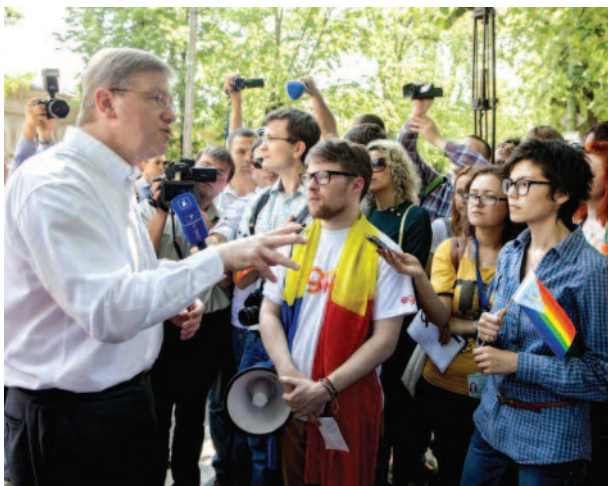
Le Commissaire européen Štefan Füle assiste à un rassemblement LGBT en Moldavie.